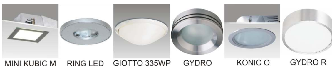
MINI KUBIC M

Większość łazienek nie ma okien, dlatego ważne jest, by barwa oświetlenia ogólnego imitowała światło naturalne. Sztuczne światło nie może nas drażnić, ani oślepić. W łazience idealnie sprawdzają się zarówno duże, płaskie oprawy nabudowane (plafony), jak i niewielkie, przystosowane do mlecznym szkłem lub tworzywem sztucznym oprawy wbudowane. Zrezygnujmy z opraw wiszących, ponieważ mogą one krępować wykonywanie codziennych czynności. Pamiętajmy, by ze względu na wilgotność panującą w pomieszczeniu podczas kąpieli, zamontować w łazience oprawy oświetleniowe o podwyższonym stopniu szczelności (minimum IP44).